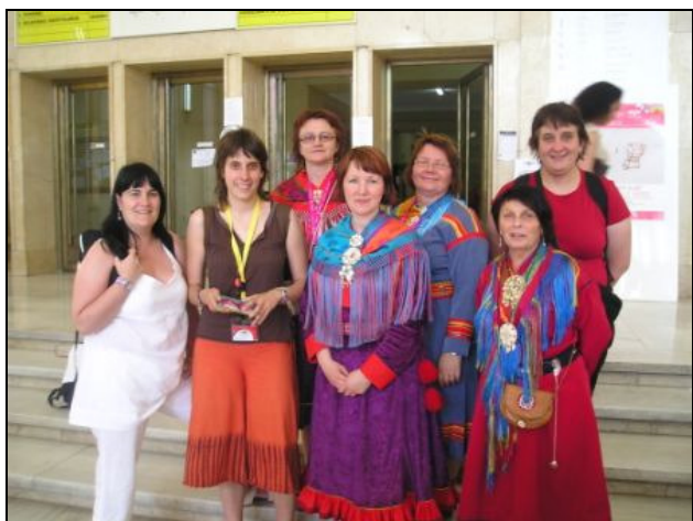
Saamelais- ja baskinaiset Madridissa heinäkuussa 2008.